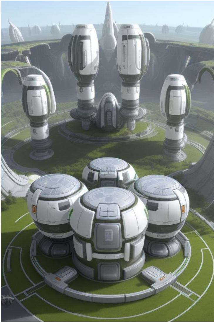
(Chungustanin pinta suuren CHUNGTEERRA -projektin jälkeen)