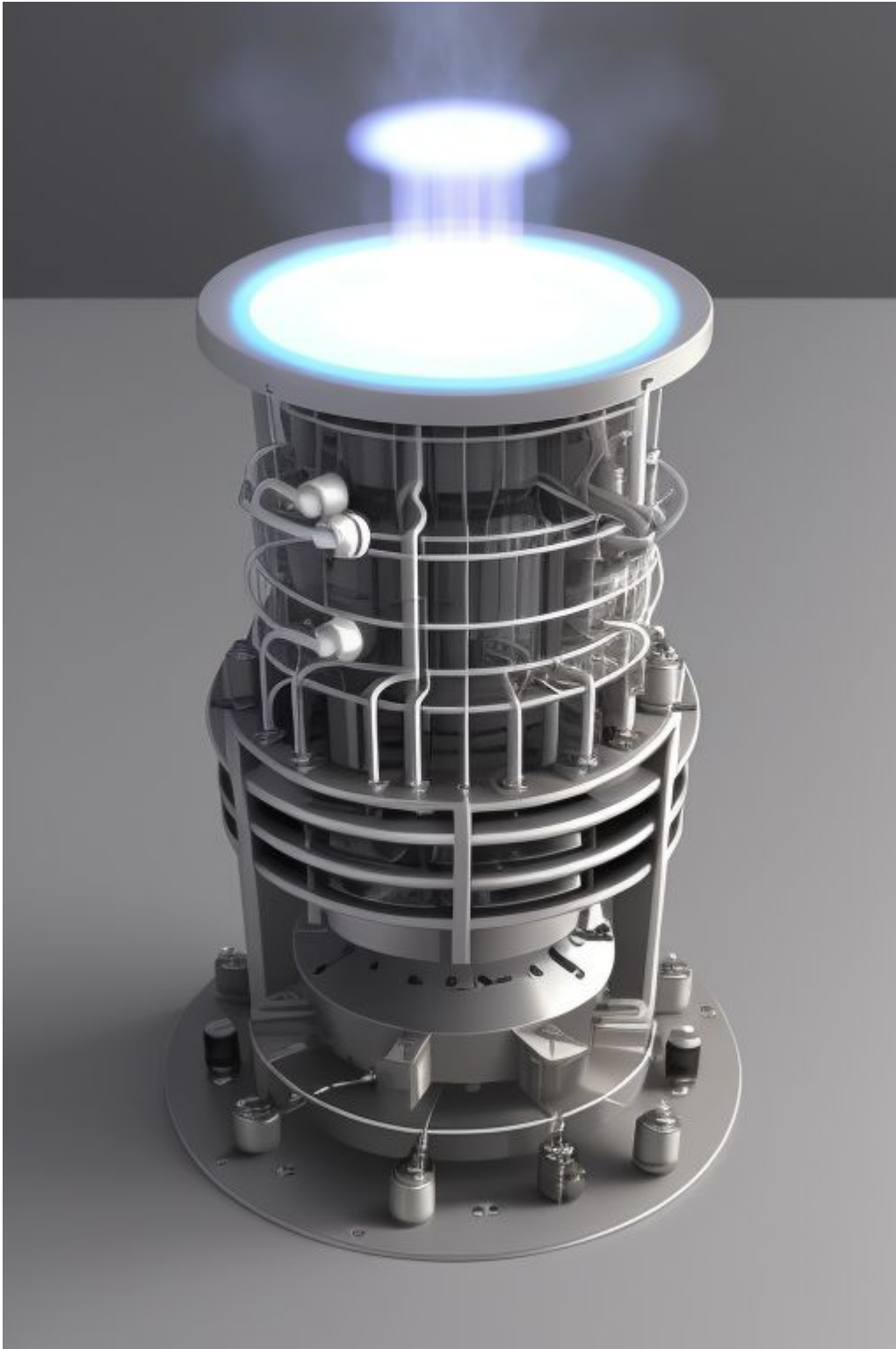
CHUNGTEK Mark 2 Aero -systemi.